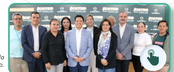
Ganadores de la 7ª edición del sorteo.

Los premios se entregarán el 21 de marzo de 2025 a cada uno de los 2,225 ganadores. De conformidad con lo establecido por la Secretaría de Gobernación, el ganador del millón de pesos y los siete de 200 mil deberán asistir a la Ceremonia de Premiación; por lo que AFORE PENSIONISSSTE contactará a los afortunados ganadores para confirmar su asistencia por medio de correo electrónico, llamada telefónica o visita a domicilio. En caso de que alguno de estos ocho ganadores no asista a la ceremonia de premiación, se considerará que el premio no fue reclamado y no podrá ser entregado posteriormente.